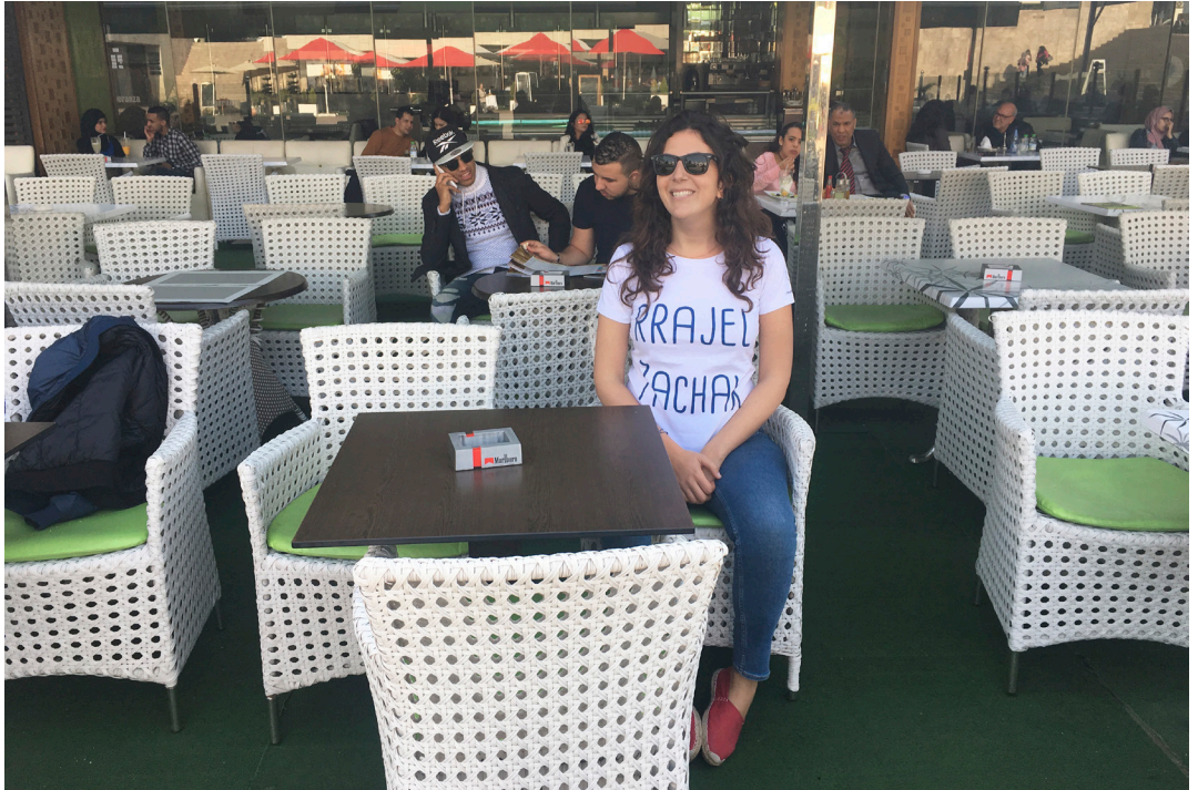
Féminisme quotidien #1 - voyage au Maroc, série de t-shirts sérigraphiés, intervention dans l'espace public, 2017